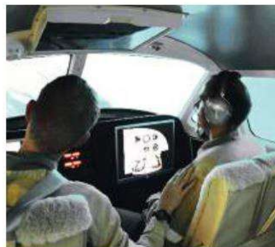
Prácticas de simulador.

SEILAF ofrece una amplia variedad de cursos, tanto online como presenciales, y tiene la capacidad de adaptar la formación a las necesidades específicas de cada cliente, todo ello conforme a los últimos