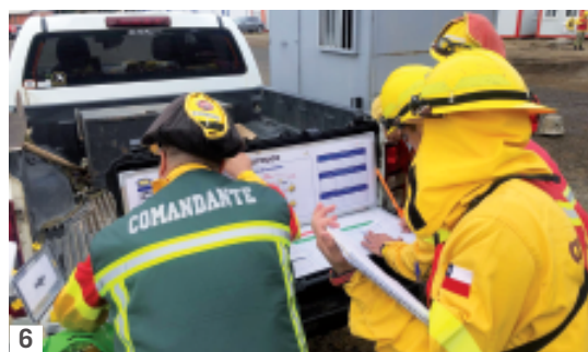
Composición de fotos: 1. Escena aérea 2. Detalle de bomberos en una simulación 3. Simulador del puesto de coordinador aéreo 4. Actividad práctica de un equipo griego 5. Diferentes modelos de helibases e infraestructura terrestre y aérea 6. Supuesto práctico 7. Prueba de coordinación y habilidad